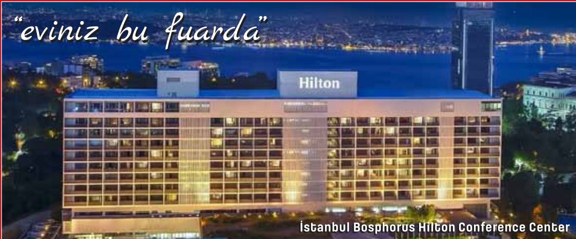
İstanbul Bosphorus Hilton Conference Center